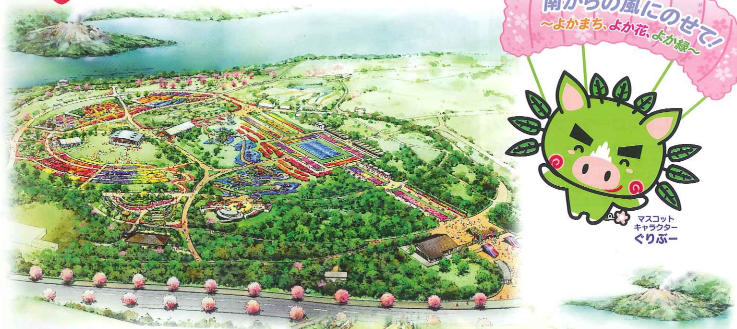
メイン会場(吉野公園)イメージパース