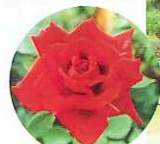
篤姫ローズ 「篤姫」をイメージした新品種のバラを展示。

鹿児島島の懐かしい田舎の風景をモチーフにした「暮らしの庭」や風格ある「さむらいの庭」、美しく気品に溢れた「おごじょの庭」で、ゆったりとした時の流れを感じることができます。