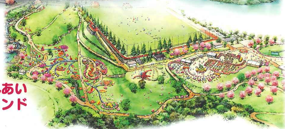
サブ会場(鹿児島ふれあいスポーツランド)イメージパース