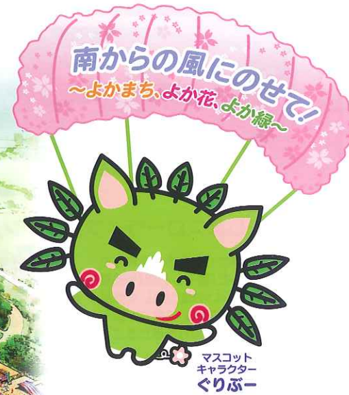
マスコットキャラクター ぐりぶー