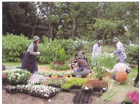
※写真は過去に開催された全国都市緑化フェアの出展作品です。